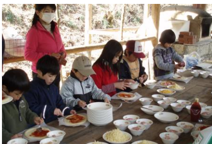
第3弾 ネイチャーゲーム(山と川を散策)&ピザ焼き 出発日: 8月26日(土)