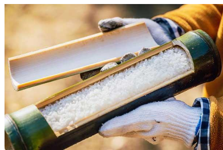
第2弾 竹ご飯づくり・竹ぼっくりづくり・竹とんぼづくり 出発日: 7月22日(土)