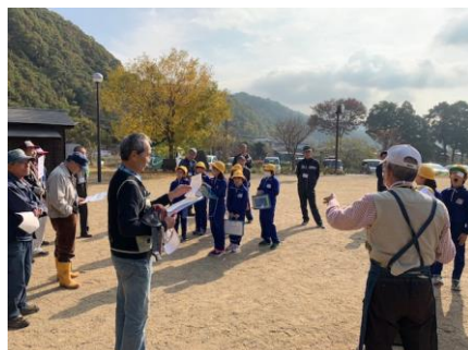
△地域の方々との交流（イメージ）