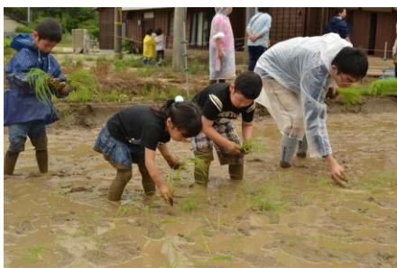
第1弾 田植え・かまどごはん&カレー作り・ジャガイモ掘り 出発日: 6月3日(土)