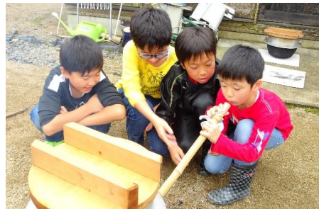
第4弾 稲刈り・かまどご飯&豚汁づくり・サツマイモ掘り 出発日: 10月7日(土)